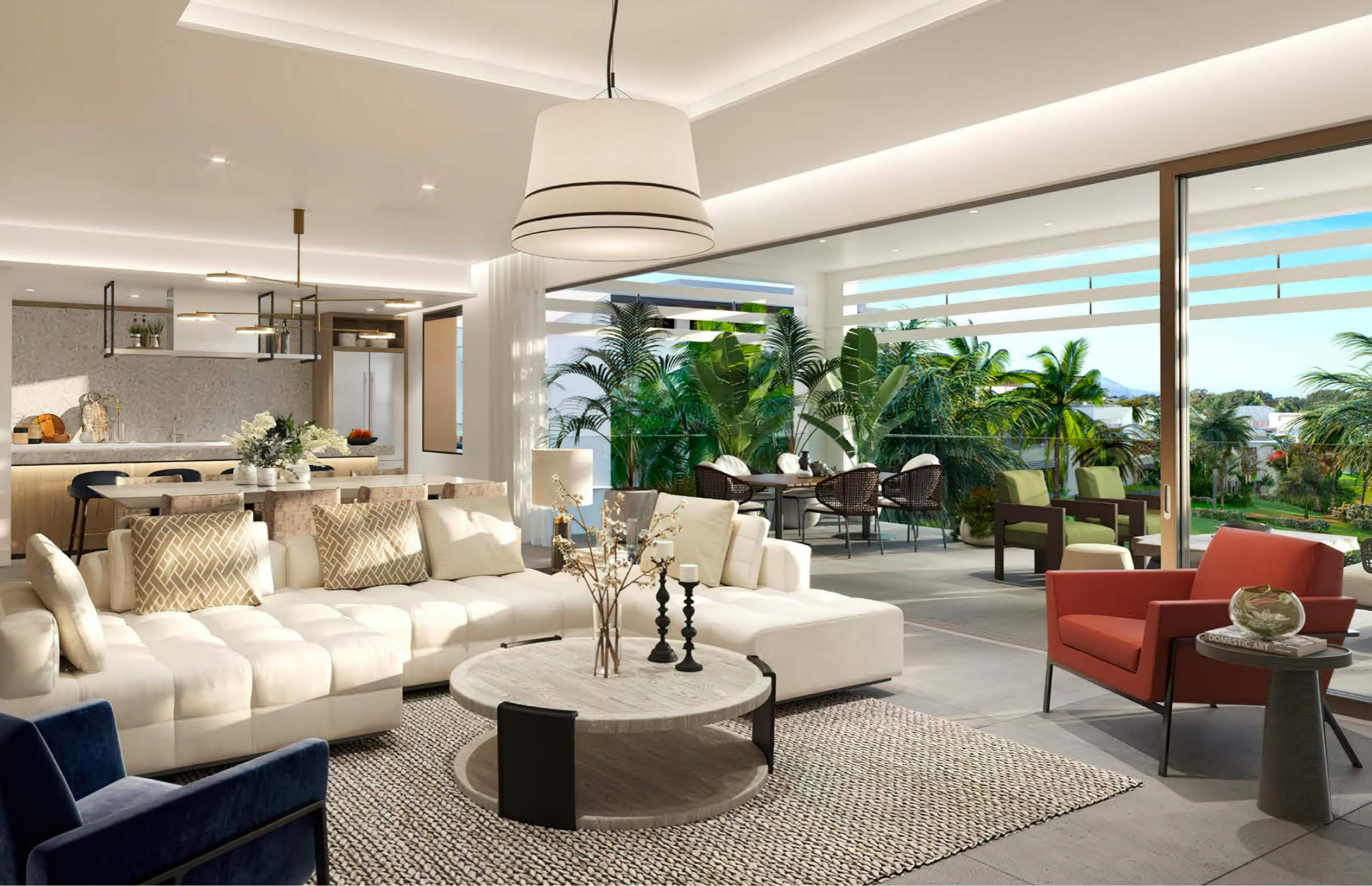
THE APARTMENTS TYPICAL 3-BEDROOM INTERIOR