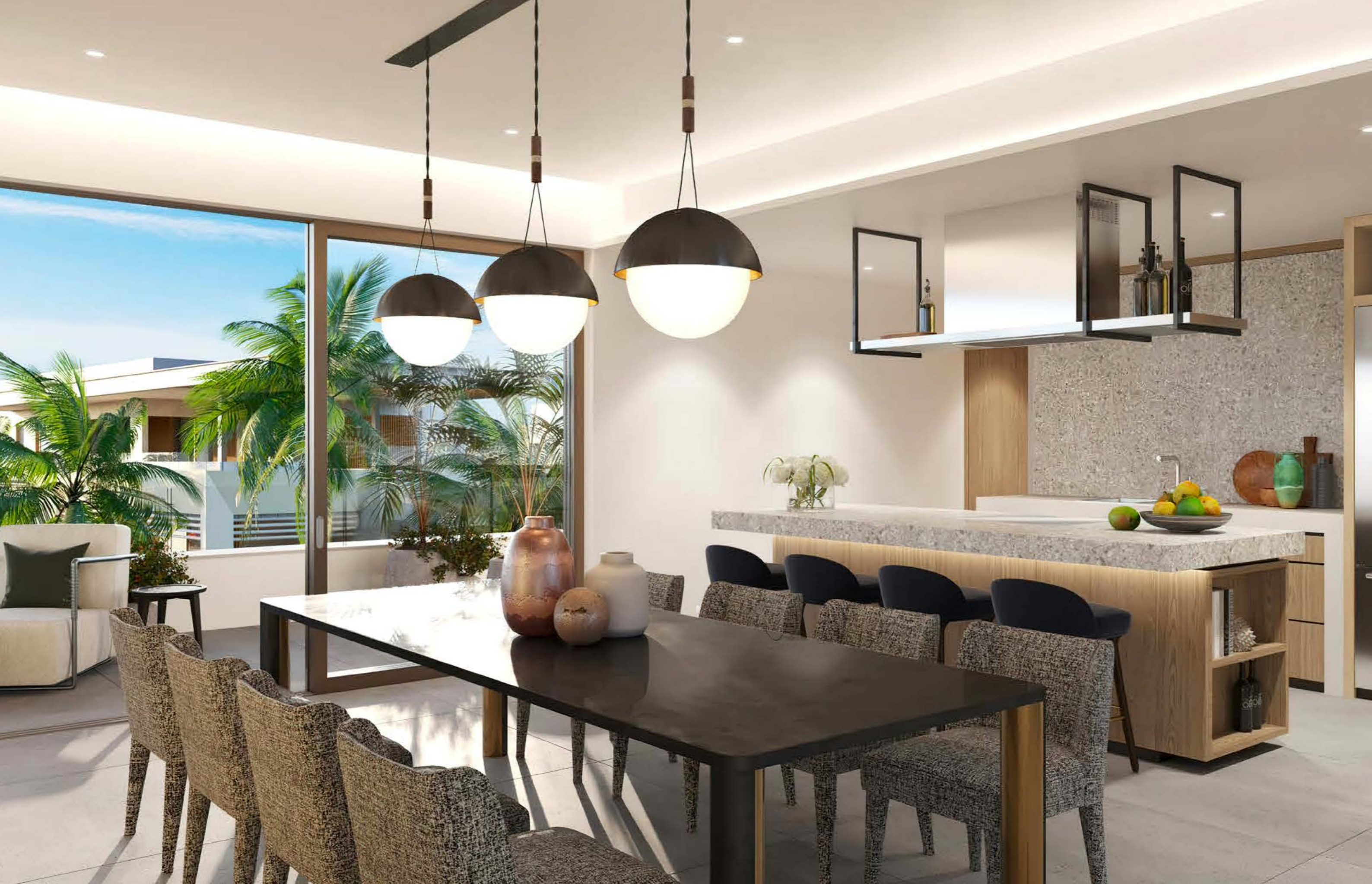
THE APARTMENTS TYPICAL 2-BEDROOM INTERIOR